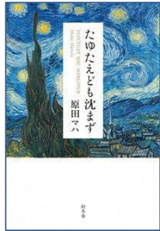
たゆたえども沈まず 原田 マハ／著 幻冬舎／刊