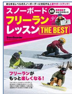
スノーボードフリーランレッスンTHE BEST 実業之日本社／刊