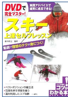
DVDで完全マスター! スキー上達セルフレッスン 藤本 剛士／監修 メイツ出版／刊