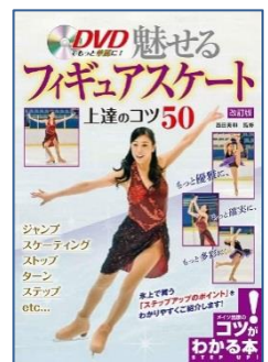
DVDでもっと華麗に! 魅せるフィギュアスケート上達のコツ50 西田 美和／監修 メイツ出版／刊