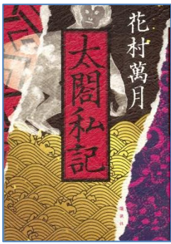
太閤私記 花村 萬月／著 講談社／刊