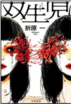
双生児 折原 一／著 早川書房／刊