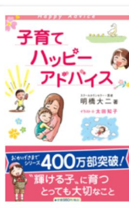
子育てハッピー アドバイス 明橋 大二 / 著 1万年堂出版