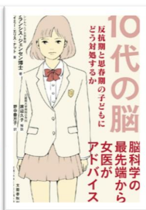
10代の脳 反抗期と思春期の子どもに どう対処するか 脳科学の 最先端から 女医が アドバイス フランシス・ジェンセン / 著 文芸春秋

※新着図書は他にも多数あります。絵本・児童書は「とよかんだより 子ども版」で紹介しています