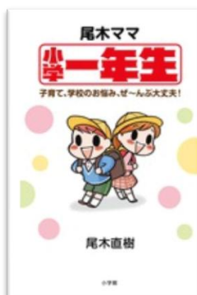
尾木ママ 小学一年生 尾木 直樹 / 著 小学館

赤ちゃん誕生から思春期まで、子育て中は悩んでばかり。イライラするときに、視点を変えたり、ヒントになる本を集めました。