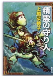
精霊の守り人 上橋 菜穂子／著 新潮社