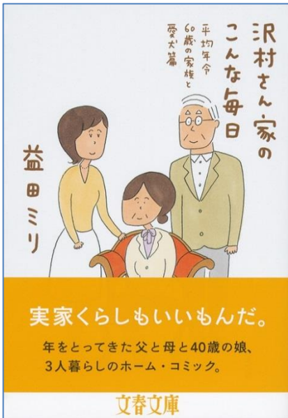
沢村さん家のこんな毎日 益田 ミリ／著 文藝春秋刊