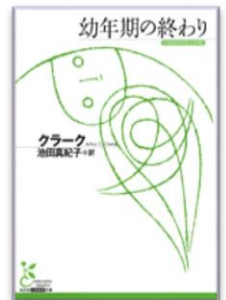
幼年期の終わり クラーク／著 光文社